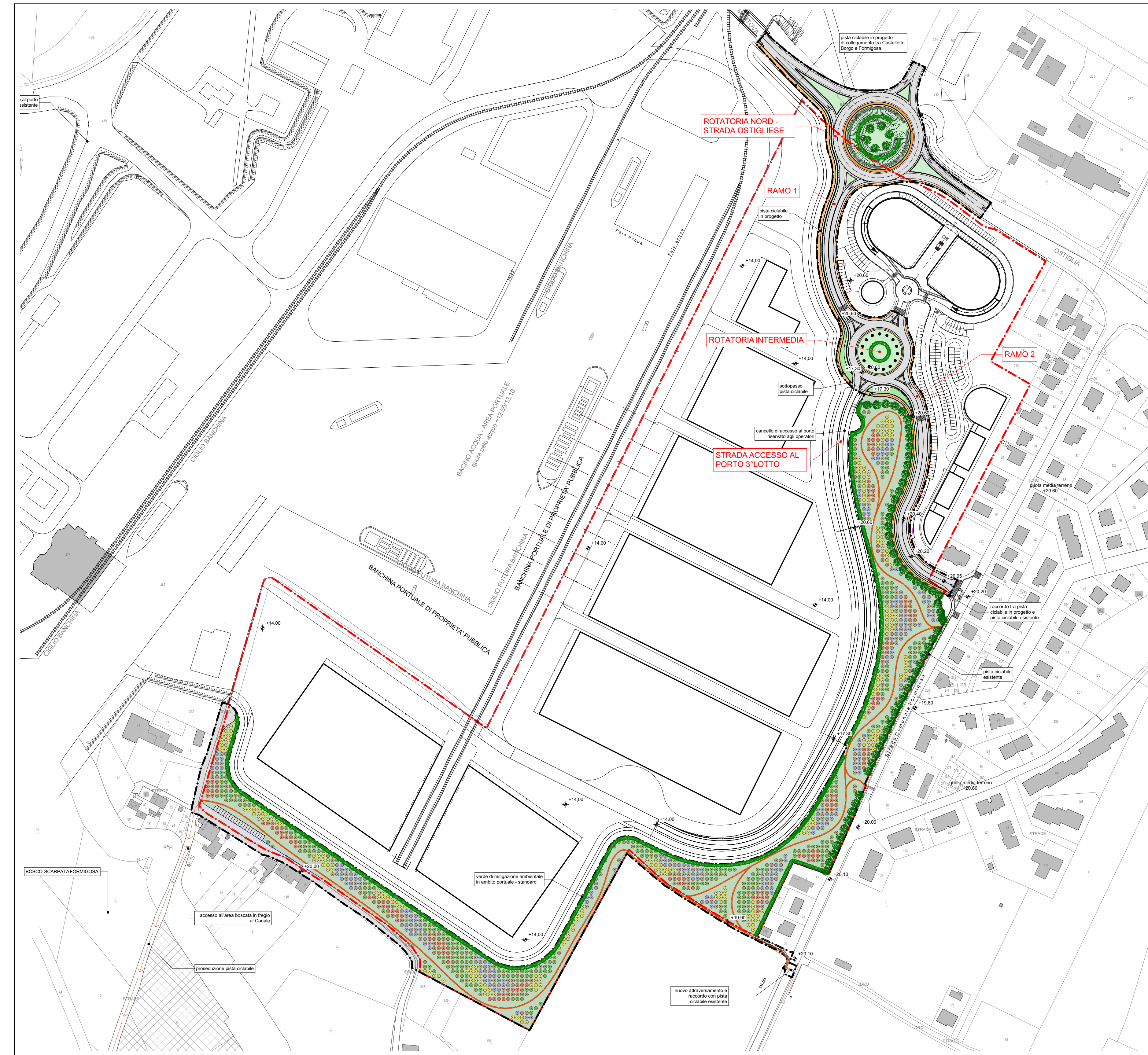
0. Opere urbanizzazione pubbliche planimetria generale 1:2000