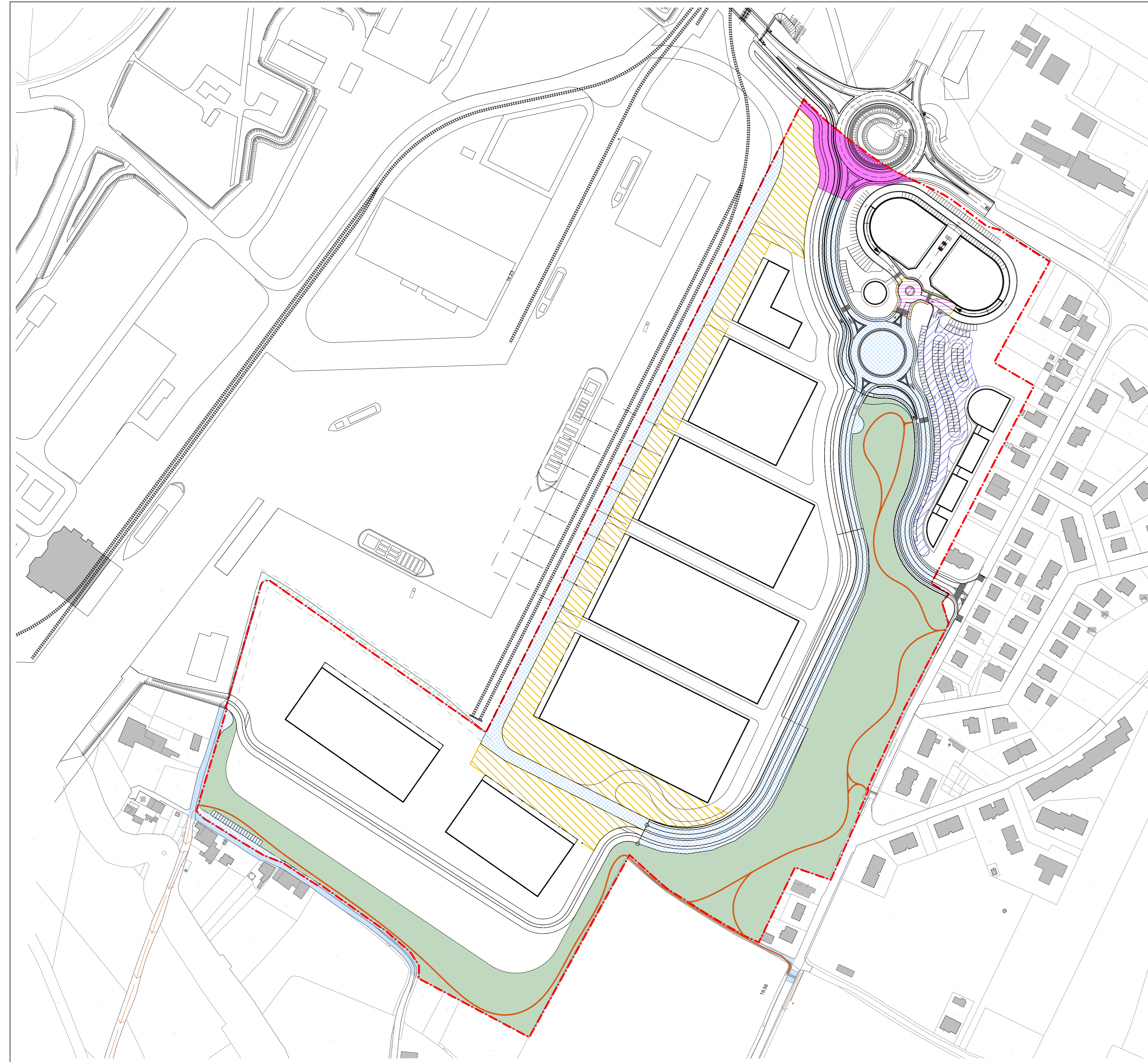
0. Aree di cessione/asservite 1:2000