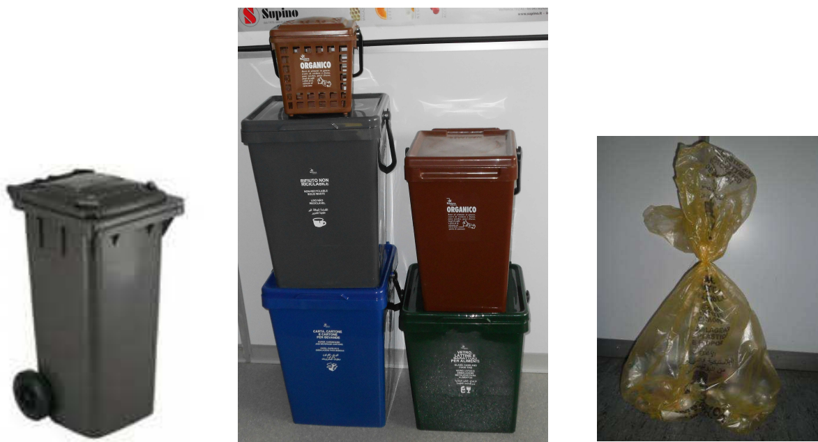
Foto 7– fornitura contenitori RD (kit standard) per raccolta domiciliare

Nei condomini, con un numero di famiglie uguale o superiore a 6, in alternativa alla dotazione singola, sono stati forniti contenitori carrellati da 240 a 1.100 lt. per la raccolta della carta, plastica, vetro e organico, in accordo con gli amministratori.