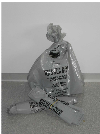
Foto 4 sacco grigio per il conferimento del rifiuto indifferenziato

Il sacco dovrà essere sempre posizionato all'interno della proprietà dell'utenza e dovrà essere esposto in occasione del giorno di raccolta previsto, sulla pubblica via.