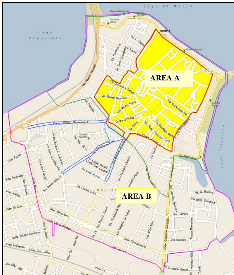
Foto 3. Cartina centro storico