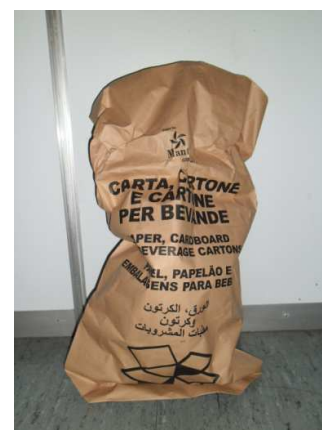
Foto 5– fornitura sacchi RD (kit standard) per raccolta domiciliare

Nei condomini, con un numero di famiglie uguale o superiore a 6, in alternativa alla dotazione singola, sono stati forniti contenitori carrellati da 240 a 1.100 lt. per la raccolta della carta, plastica, vetro e organico, in accordo con gli amministratori.