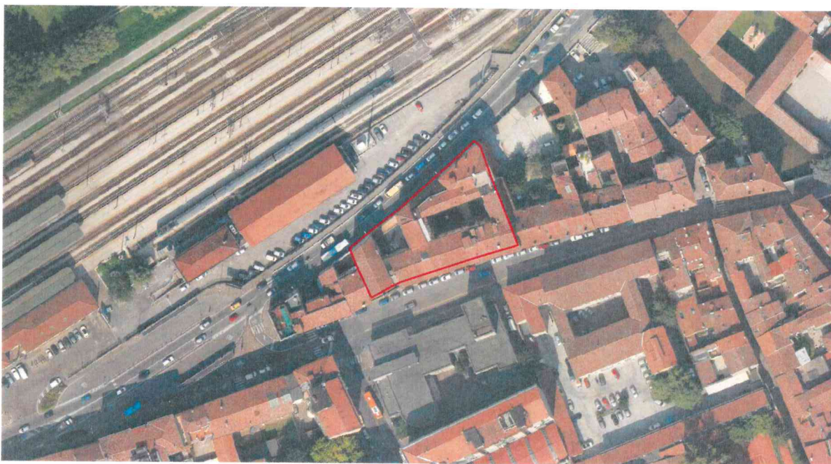
Foto aerea con individuazione del comparto

La classificazione proposta non comporta adeguamento a indici o funzioni previste dalla disciplina degli artt. D13-D15 del Piano delle Regole.