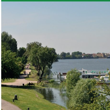
PARCO PERIURBANO E LAGO DI MEZZO (Foto Archivio Comune di Mantova)