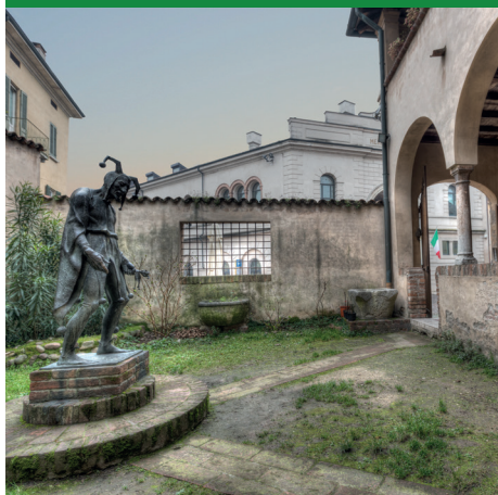
CASA DEL RIGOLETTO. GIARDINO