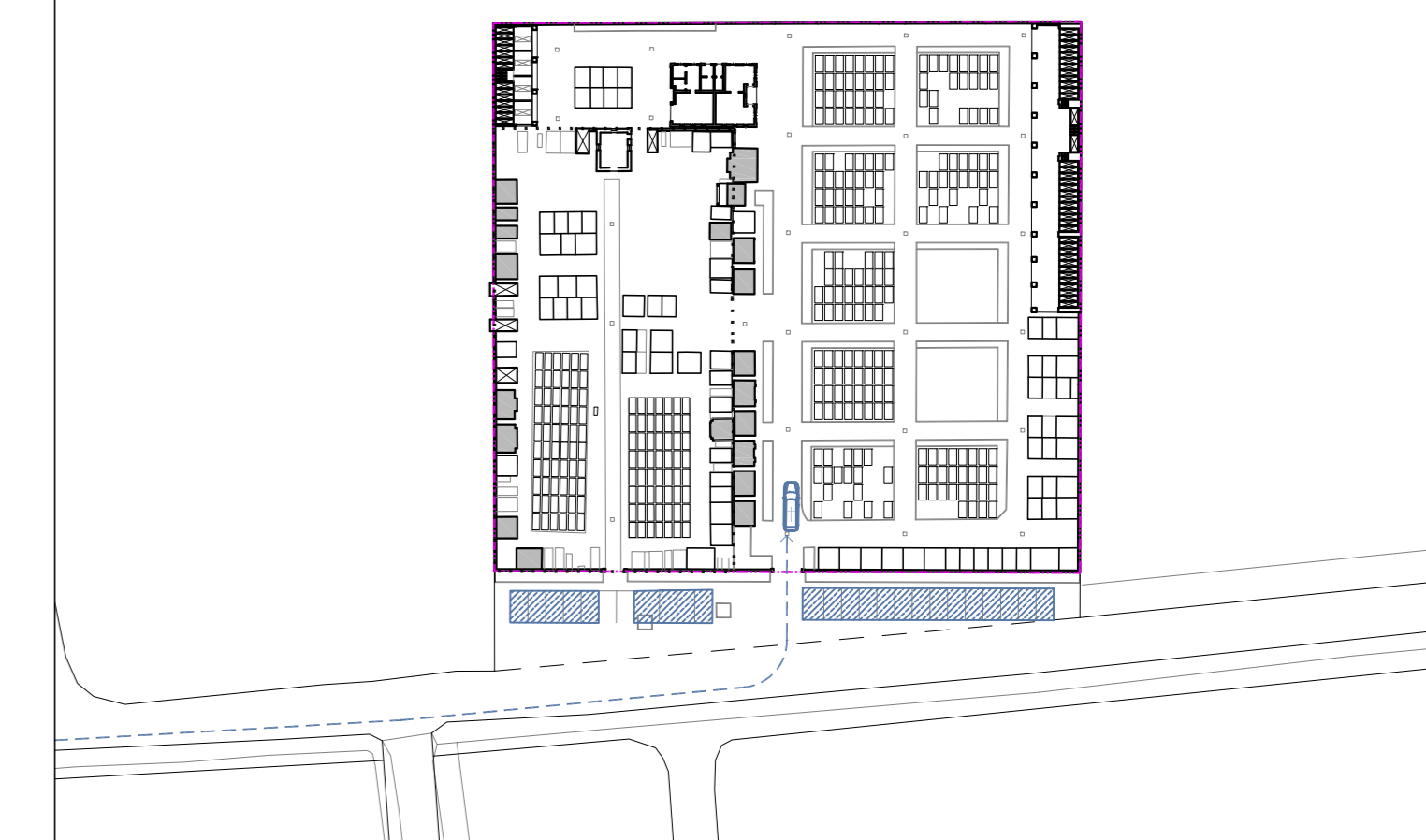
SEPOLTURE: DISPONIBILITÀ PER TIPOLOGIA al settembre 2014